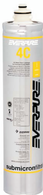
4C Filterpatrone EV960100

Liefert Premiumwasser höchster Qualität für Kaltgetränkessysteme